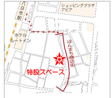
八日市駅からほんまち商店街までのアクセス