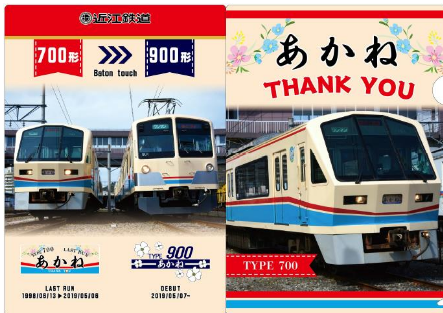
THANK YOU「あかね号」クリアファイル（イメージ）

オリジナルグッズの一般販売は、5月9日（木）より近江鉄道各駅（彦根駅・八日市駅・近江八幡駅・貴生川駅）で行います。本イベントで売り切れの場合、一般販売はございません。