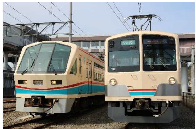
（左）5月に引退する700形車両 （右）「あかね号」を継承する900形車両