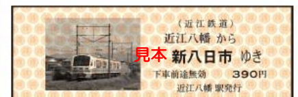
700 形「あかね号」引退記念乗車券（イメージ）