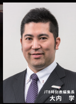
JTB時刻表編集長講演会