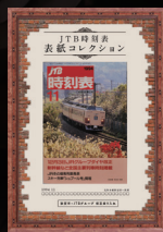
JTB時刻表パネル展 (イメージ)